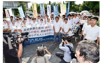
広島地裁の不当判決に抗議 (7/19)